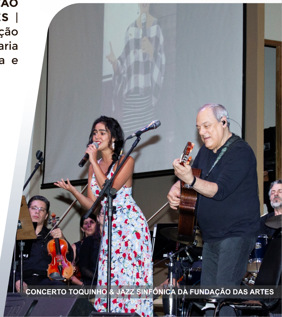
CONCERTO TOQUINHO & JAZZ SINFÔNICA DA FUNDAÇÃO DAS ARTES

Em parceria com a Associação Comercial de São Caetano do Sul, a instituição realizou concerto com a participação do cantor Toquinho e Jazz Sinfônica da Fundação das Artes. O show, em comemoração aos 81 anos da ACISCS, foi realizado no Buffet Samyr, onde mais de mil pessoas prestigiaram o concerto, que teve a abertura do Trio de Jazz Som na Calçada.