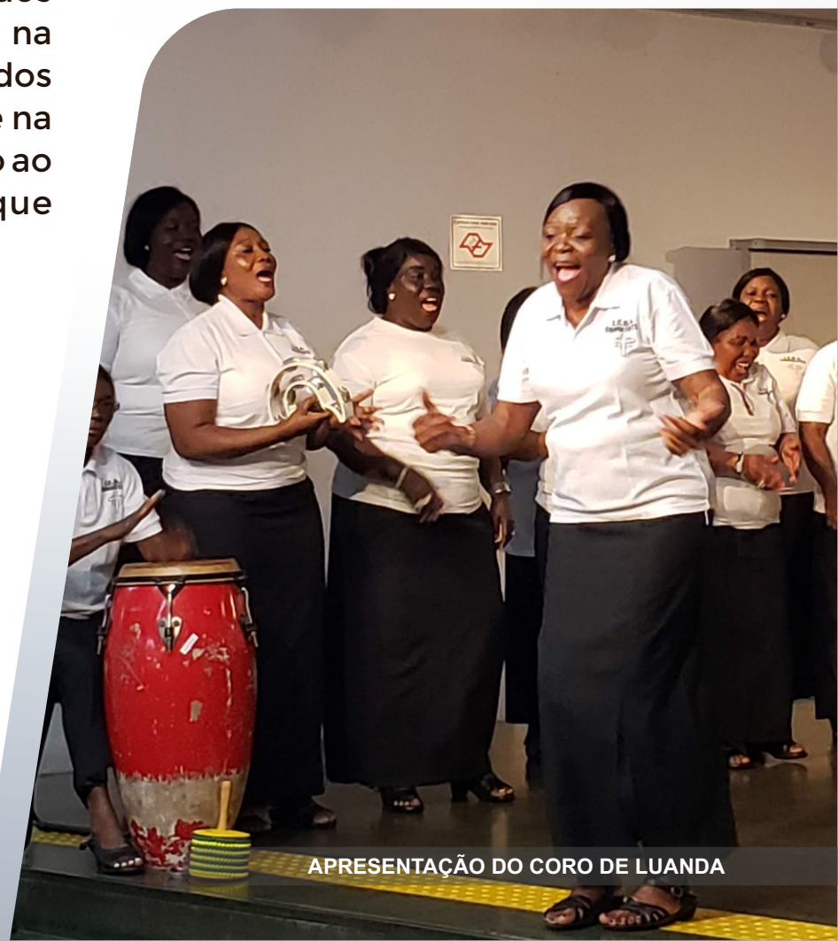
APRESENTAÇÃO DO CORO DE LUANDA

A Fundação das Artes de São Caetano do Sul recebeu no dia 21/08, às 18h, no saguão da instituição, o coro de Luanda, composto por cerca de quarenta mulheres, Kiese muna Yisu. O grupo já se apresentou em diversos países, como França, Bélgica e República Democrática do Congo.