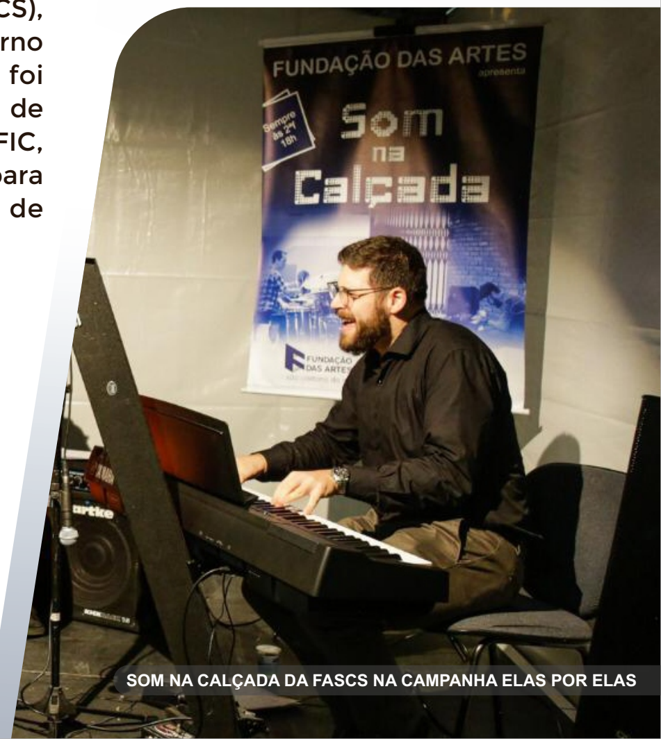
SOM NA CALÇADA DA FASCS NA CAMPANHA ELAS POR ELAS

O projeto “Som na Calçada” da Fundação das Artes, participou do lançamento da Campanha “Elas por Elas”, - projeto de conscientização e prevenção ao câncer de mama, realizado pelo Fundo Social de Solidariedade de São Caetano do Sul, em parceria com a Secretaria de Saúde.