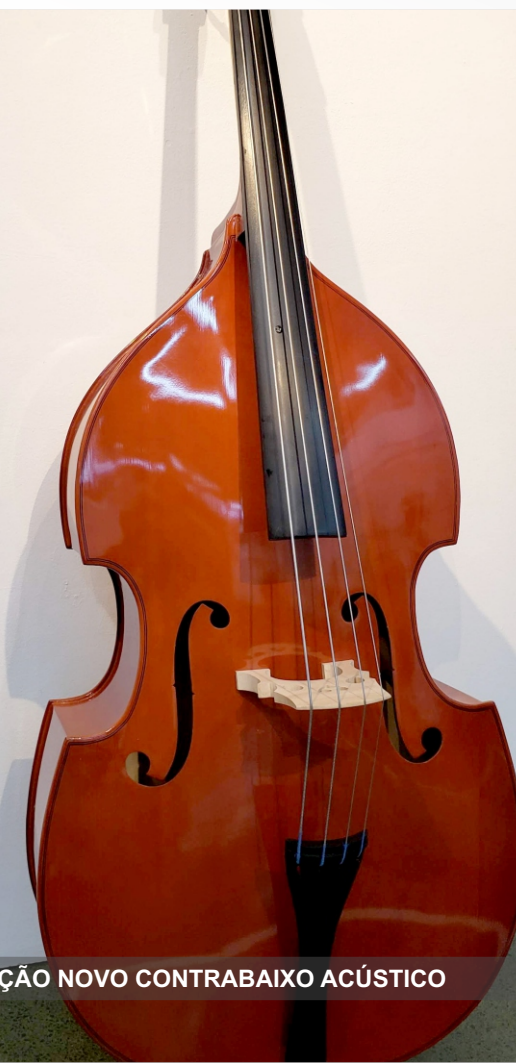
AQUISIÇÃO NOVO CONTRABAIXO ACÚSTICO

Reuniões semanais com os Coordenadores Técnicos, com vistas à apropriação da estrutura pedagógica dos cursos técnicos de Teatro, Instrumento Musical e de Canto Teatro e dos Cursos Livres de Artes Visuais, Dança, Música e Teatro; Ações pedagógicas.